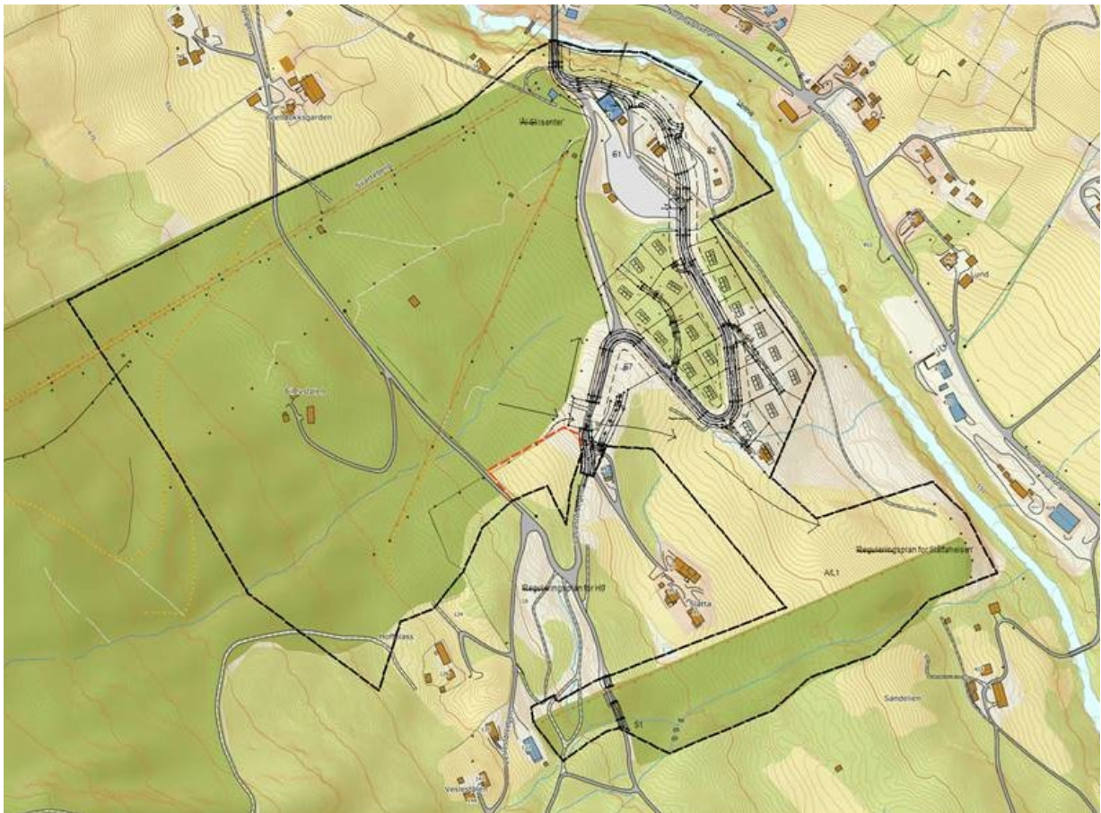
Figur 2: Avgrensning planområdet markert med rød stiplede linje.